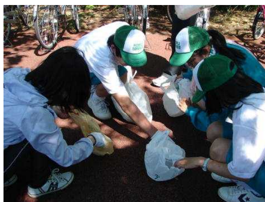
ボランティアの様子