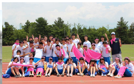
運動会での 1 コマ